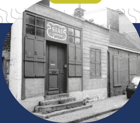
LA CLÉ en 1985